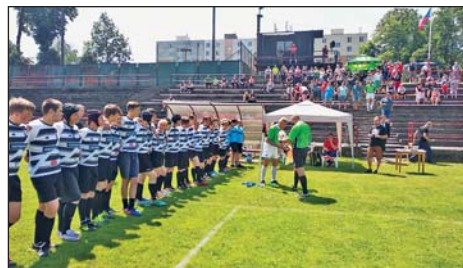
MÍSTO sokolů na mistrovství ČR v kategorii do 14 let.