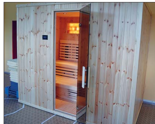
DO SAUNY ve školce se vejde až dvanáct dětí

rehabilitační infra sauna, doplněné o podsvícenou stěnu se solnou terapií a reproduktory pro relaxační hudbu. „Náš obvod mnoho let trápí ekologická zátěž z lagun, ale samozřejmě i jiné problémy související se stavem ovzduší ve městě. Dlouhodobě se proto snažíme děti chránit a předcházet jejich zdravotním komplikacím. Po ozdravných pobytech na horách a adaptačních pobytech prvňáčků u moře v Chorvatsku, které naše radnice organizuje, jsou rehabilitační sauny ve školkách další možností, jak podpořit imunitu dětí z našeho obvodu,“ uzavírá starosta Hujdus.