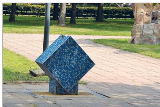
NOVÉ PÍTKO před ZŠ Gen. Janka zdobí mozaika v modrých odstínech

s půdorysem zhruba 3 krát 2 m a 6 krát 2 m, s vnitřním osvětlením a elektrickým rozvodem s nízkým příkonem. Prodávány sortiment musí odpovídat zaměření akce. Zájemci o pronájem prodejních stánků či další informace mohou své nabídky a dotazy zaslat na email: akce@marianskehory.cz