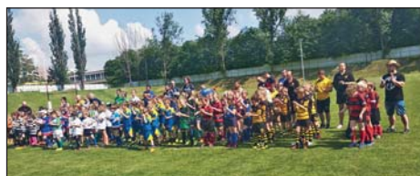
TURNAJ dětí od pěti do dvanácti let Ostrava.

Ragbisté Sokola Mariánských Hor slaví velký úspěch v kategorii U14. V letošním roce získali stříbro v celostátní lize, které se účastní 22 klubů z celé České republiky. Ve finále nestačili chlapi a dívky na tým RC Brno Bystrc a tak titul unikl o vlásek. Titul „vice-mistrů“ však získali letos hned dvakrát, což je historický klubový úspěch, po XV ragby zabo-